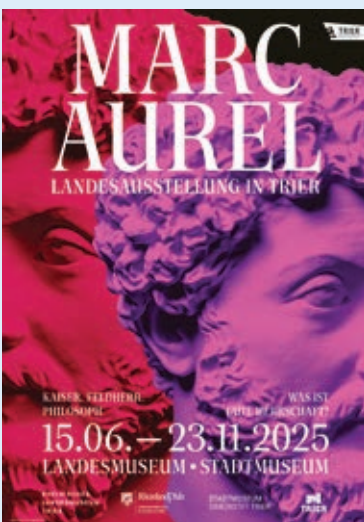
Plakat zur Landesausstellung „Marc Aurel“ 2025 in Trier, polyform und studio edgar kandratian/Rheinisches Landesmuseum Trier (GDKE)